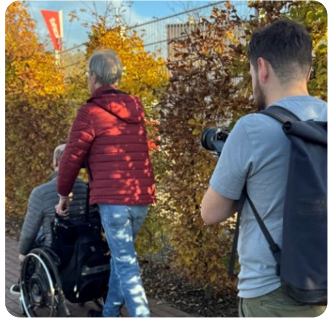
Videodreh zu unseren neuen Kurzfilmen "Ehrensache"

Zwei Beiträge möchte ich Ihnen darüber hinaus besonders ans Herz legen: